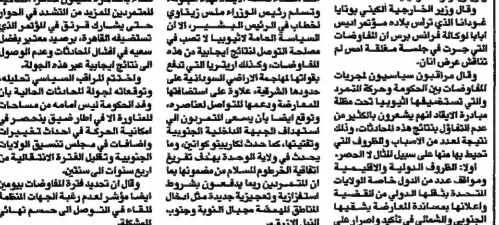
سيدة عراقية من مملها في بغداد

القاهرة 6 آب - ترحب قيادة حركة قرني والخرطوم بعرض كوفي آنان للوساطة للتوصل إلى تسوية في الجنوب. وقال مسؤول من حركة قرني، إن العرض الذي تقدمه كوفي آنان للوساطة، يفتح آفاقاً جديدة للتوصل إلى تسوية في الجنوب. وقال مسؤول من حركة قرني، إن العرض الذي تقدمه كوفي آنان للوساطة، يفتح آفاقاً جديدة للتوصل إلى تسوية في الجنوب.